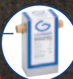
GRANDER® Urządzenia przepływowe